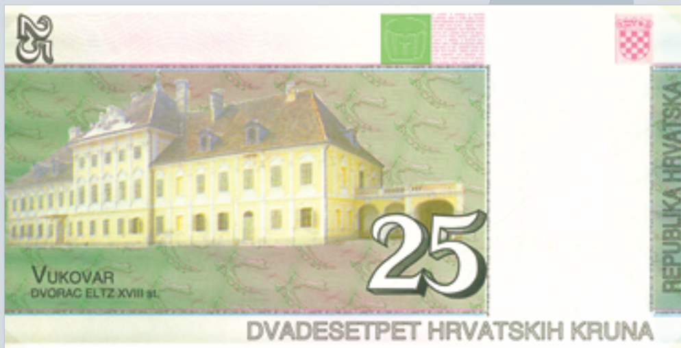
Prijedlog novčanice od 25 kruna, autori M. Šutej i V. Žiljak, 1992., naličje 25 kuna banknote, proposal by M. Šutej and V. Žiljak, 1992, reverse