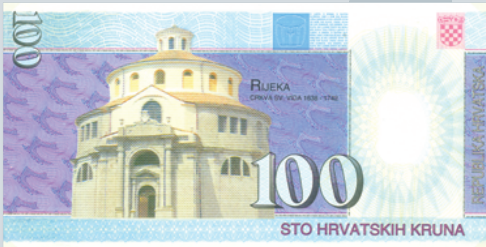
Prijedlog novčanice od 100 kruna, autori M. Šutej i V. Žiljak, 1992., naličje 100 kuna banknote, proposal by M. Šutej and V. Žiljak, 1992, reverse