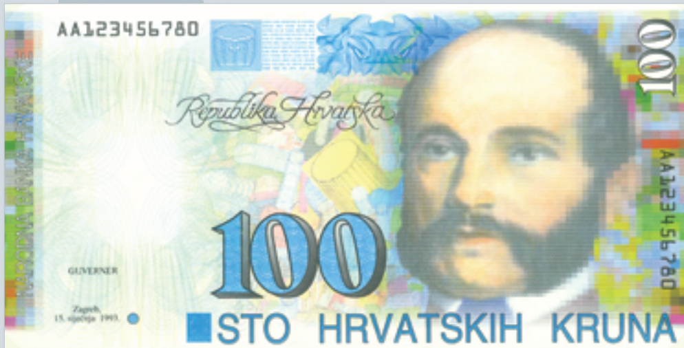
Prijedlog novčanice od 100 kuna, autori M. Šutej i V. Žiljak, 1992., lice 100 kuna banknote, proposal by M. Šutej and V. Žiljak, 1992, obverse