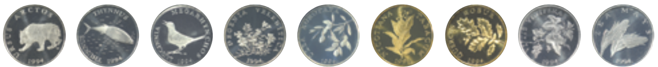
Optjecajni kovani novac kuna i lipa, naličja Kuna and lipa circulation coins, reverses