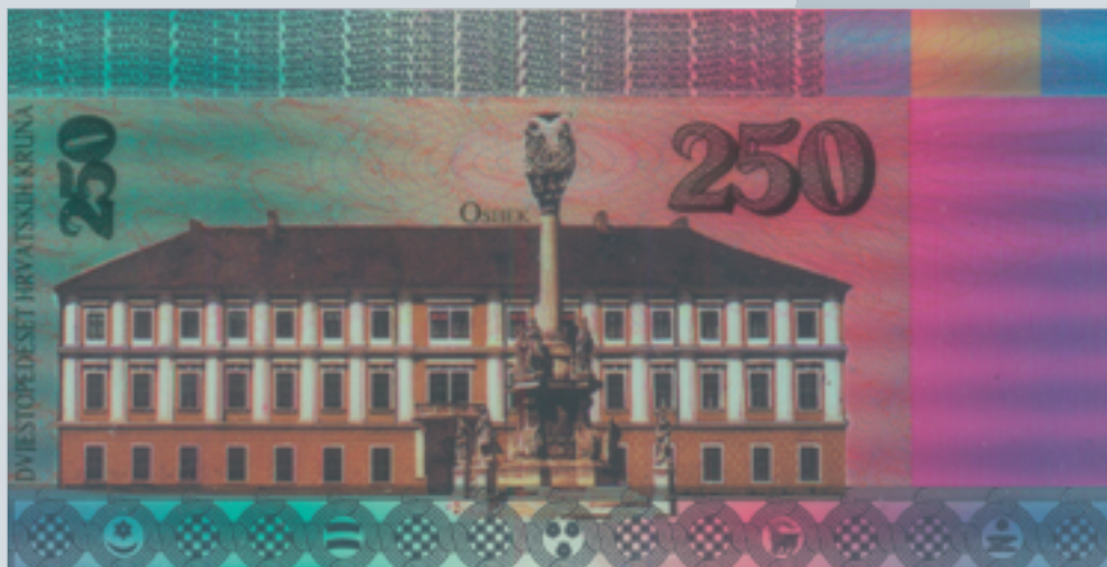
Prijedlog novčanice od 250 kruna, autori M. Šutej i V. Žiljak, 1992., naličje 250 kuna banknote, proposal by M. Šutej and V. Žiljak, 1992, reverse