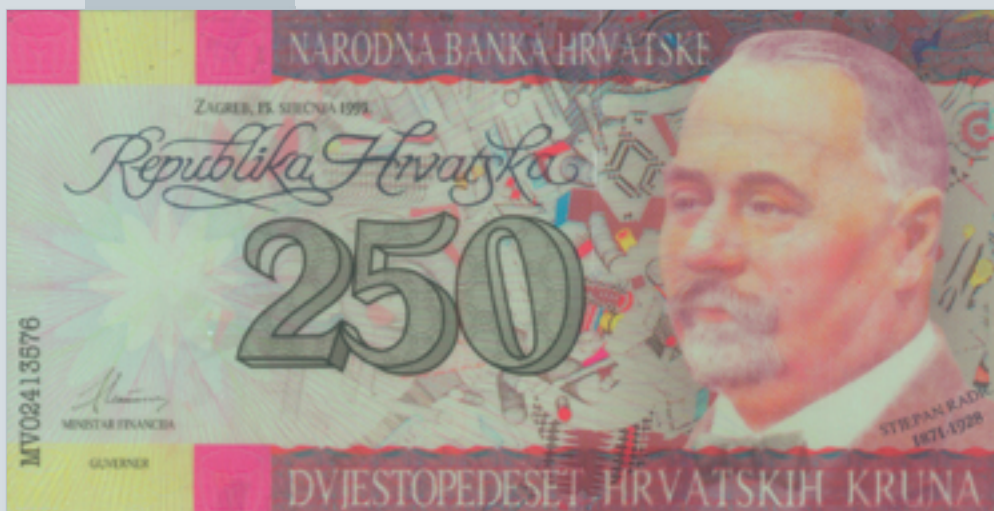
Prijedlog novčanice od 250 kuna, autori M. Šutej i V. Žiljak, 1992., lice 250 kuna banknote, proposal by M. Šutej and V. Žiljak, 1992, obverse