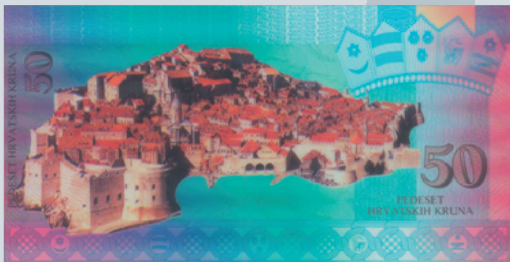
Prijedlog novčanice od 50 kruna, autori M. Šutej i V. Žiljak, 1992., naličje 50 kuna banknote, proposal by M. Šutej and V. Žiljak, 1992, reverse