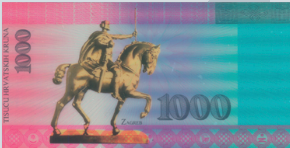
Prijedlog novčanice od 1000 kruna, autori M. Šutej i V. Žiljak, 1992., naličje 1000 kuna banknote, proposal by M. Šutej and V. Žiljak, 1992, reverse