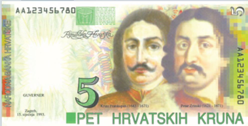
Prijedlog novčanice od 5 kruna, autori M. Šutej i V. Žiljak, 1992., lice 5 kruna banknote, proposal by M. Šutej and V. Žiljak, 1992, obverse