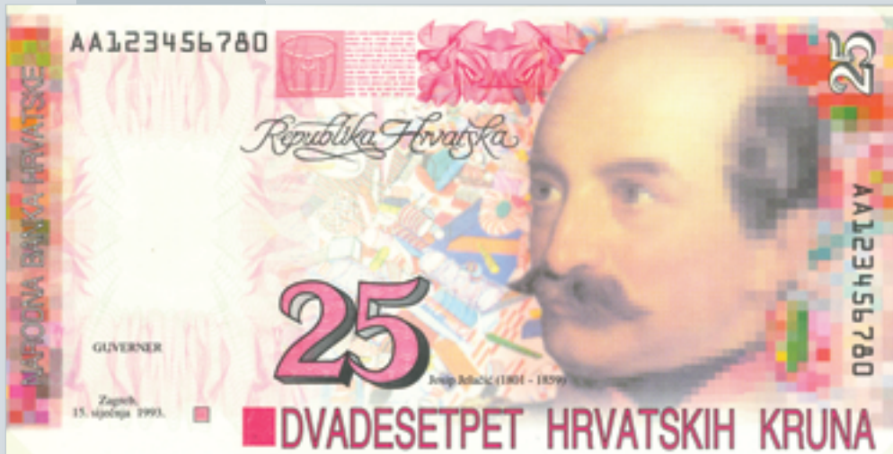
Prijedlog novčanice od 25 kruna, autori M. Šutej i V. Žiljak, 1992., lice 25 kuna banknote, proposal by M. Šutej and V. Žiljak, 1992, obverse