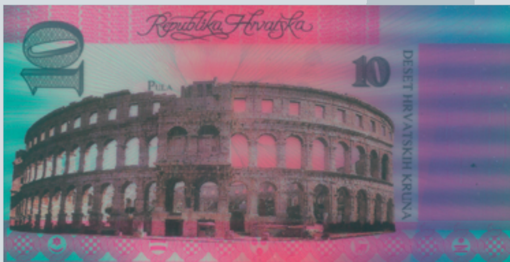
Prijedlog novčanice od 10 kruna, autori M. Šutej i V. Žiljak, 1992., naličje 10 kruna banknote, proposal by M. Šutej and V. Žiljak, 1992, reverse