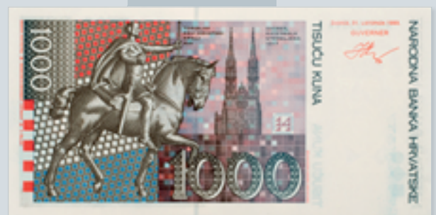
Komplet novčanica hrvatske kune, apoeni od 100, 200, 500 i 1000 kn Set of Croatian kuna banknotes in denominations of 100, 200, 500 and 1000 kuna