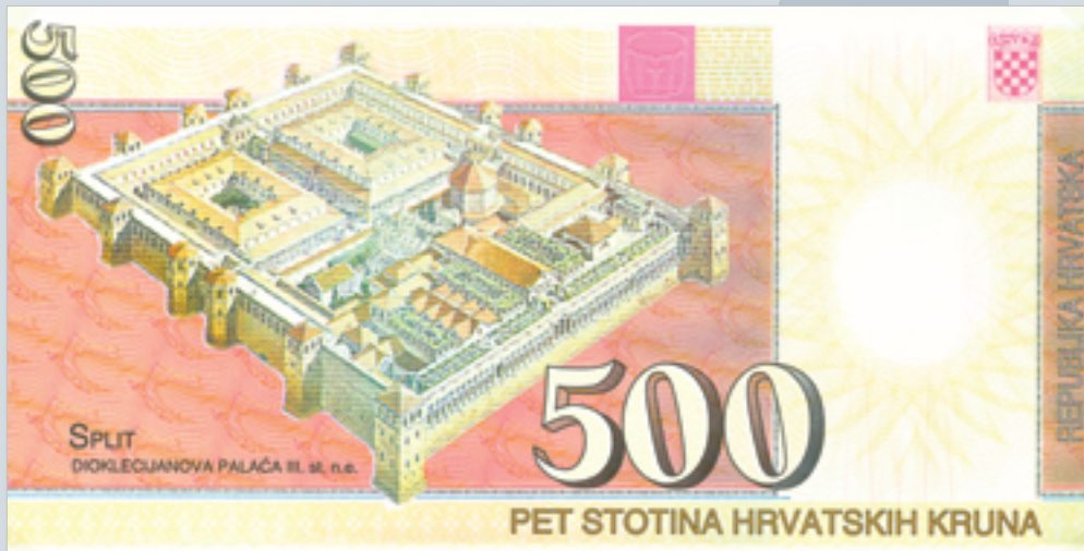
Prijedlog novčanice od 500 kruna, autori M. Šutej i V. Žiljak, 1992., naličje 500 kuna banknote, proposal by M. Šutej and V. Žiljak, 1992, reverse