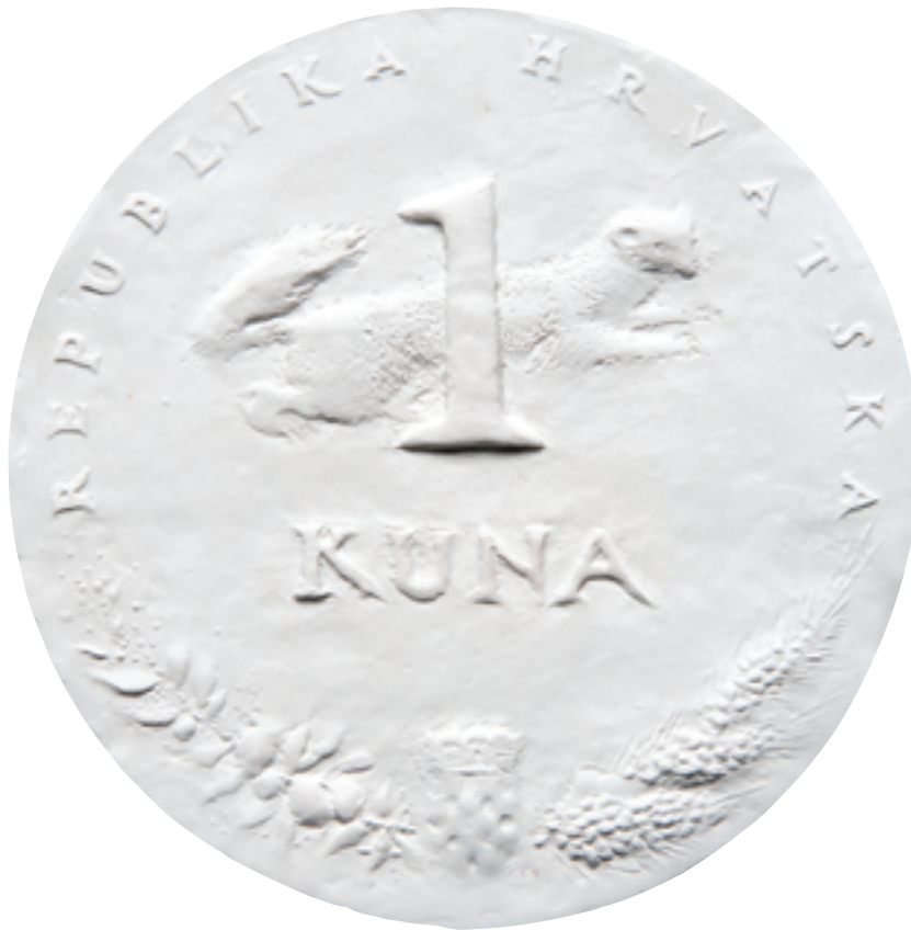
Sadreni model kovanice od 1 kune, autor Kuzma Kovačić, 1993., lice Plaster model of 1 kuna coin by Kuzma Kovačić, 1993, obverse