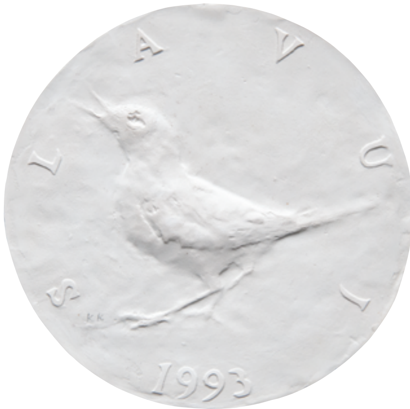
Sadreni model kovanice od 1 kune, autor Kuzma Kovačić, 1993., naličje Plaster model of 1 kuna coin by Kuzma Kovačić, 1993, reverse