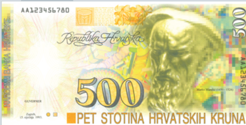
Prijedlog novčanice od 500 kuna, autori M. Šutej i V. Žiljak, 1992., lice 500 kuna banknote, proposal by M. Šutej and V. Žiljak, 1992, obverse