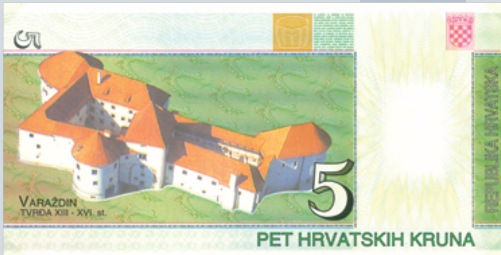
Prijedlog novčanice od 5 kruna, autori M. Šutej i V. Žiljak, 1992., naličje 5 kruna banknote, proposal by M. Šutej and V. Žiljak, 1992, reverse