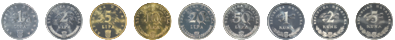
Optjecajni kovani novac kuna i lipa, lica Kuna and lipa circulation coins, obverses