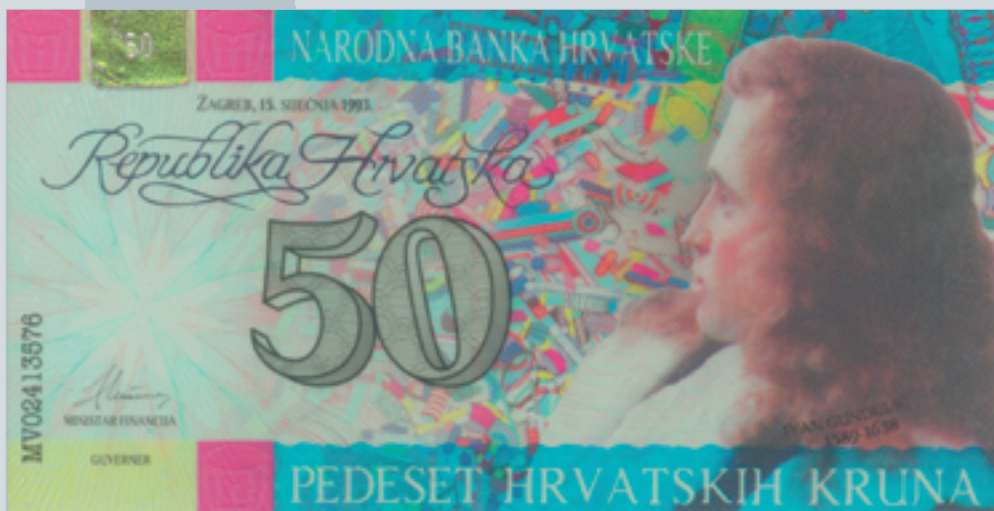
Prijedlog novčanice od 50 kruna, autori M. Šutej i V. Žiljak, 1992., lice 50 kuna banknote, proposal by M. Šutej and V. Žiljak, 1992, obverse