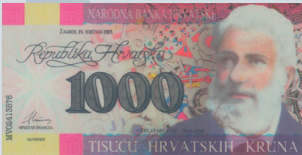
Prijedlog novčanice od 1000 kuna, autori M. Šutej i V. Žiljak, 1992., lice 1000 kuna banknote, proposal by M. Šutej and V. Žiljak, 1992, obverse