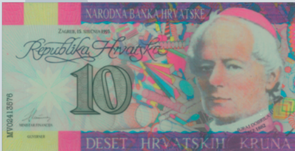
Prijedlog novčanice od 10 kruna, autori M. Šutej i V. Žiljak, 1992., lice 10 kruna banknote, proposal by M. Šutej and V. Žiljak, 1992, obverse